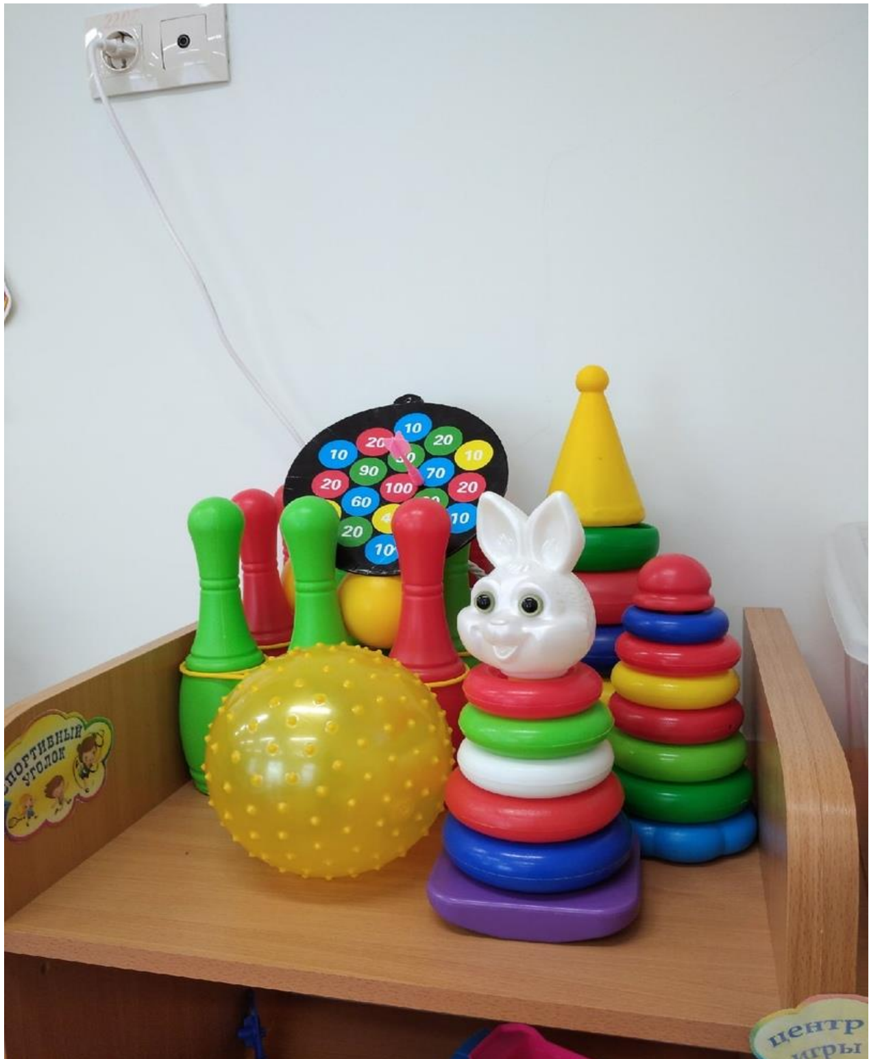
Экологический центр. Уголок природы.